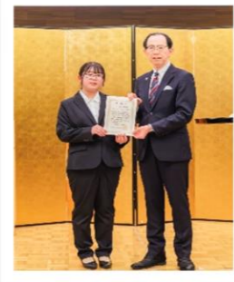
第6回キラリふくしま介護賞