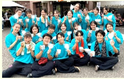
霊山太鼓保存会 の皆さま