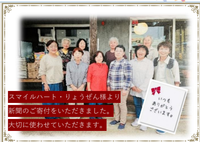
スマイルハート・りょうぜん様より 新聞のご寄付をいただきました。 大切に使用させていただきます。