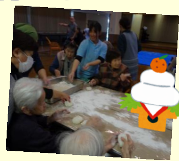
ファミリー保育所の子供たちも参加してくれました